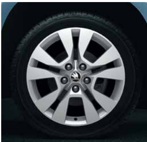
Llanta de aleación 7.0J x 17" Origami para neumático 225/50 R17 en diseño plateado (5LO 071 497L 8Z8).