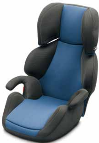
Wavo 1-2-3 Silla infantil (5LO 019 900B)