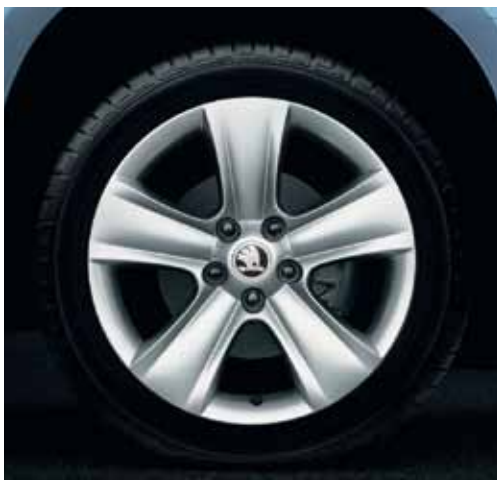
Llanta de aleación New Dolomite 7.0J x 16" para neumático 205/55 R16