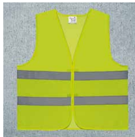
Chaleco reflectante ligero 100% poliéster de color amarillo fluorescente. Viene en una bolsa de tela. Gran parte del equipamiento de seguridad del vehículo (3TO 093 056) está disponible también en color naranja (XXA 009 001).