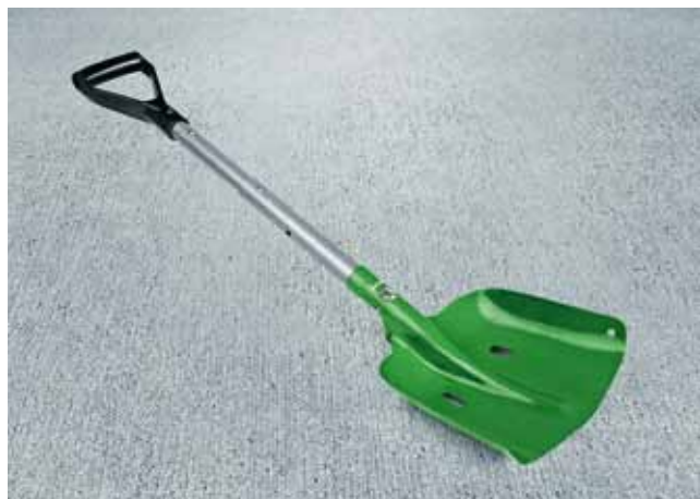
Pala plegable en tres para la nieve hecha de aleación, 750 gr, incluye una práctica funda de tela (5L0 099 320).