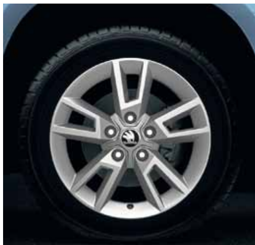
Llanta de aleación 7.0J x 16" Forest para neumático 205/55 R16 en diseño plateado (5L0 071 496B 8Z8).