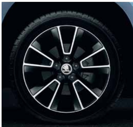
Llanta de aleación 7.0J x 17" Matterhorn para neumático 225/50 R17 en diseño negro brillo (5LO 071 497H FL8).