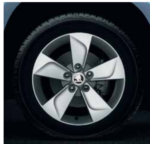
Llanta de aleación 7.0J x 16" Nevis para neumático 225/50 R17 en diseño plateado 205/55 R16 (5L0 071 496A 8Z8).