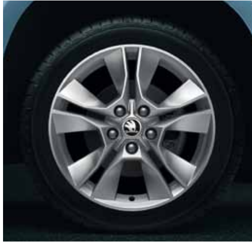
Llanta de aleación 7.0J x 17" Blossom para neumático 225/50 R17 en diseño plateado (5L0 071 497A 8Z8).