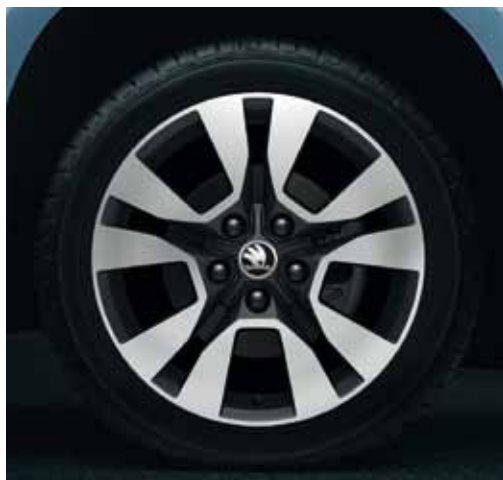
Llanta de aleación 7.0J x 17" Origami para neumático 225/50 R17 en diseño negro brillo (5LO 071 497K FL8).