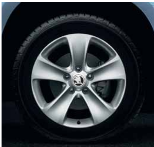
Llanta de aleación 7.0J x 16" Moon para neumático 205/55 R16 en diseño plateado (3T0 071 496A 7ZS).