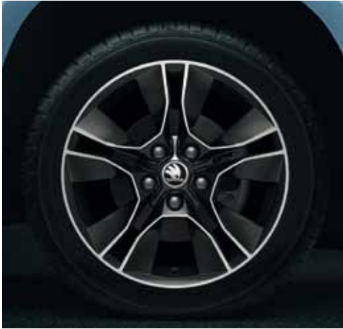
Llanta de aleación 7.0J x 17" Blossom para neumático 225/50 R17 en diseño negro brillo (5L0 071 497A JX2).