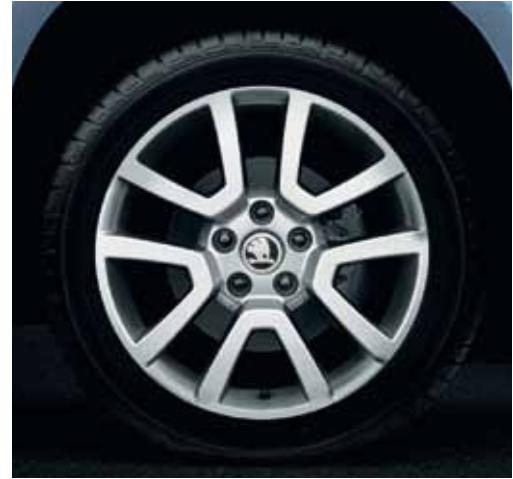
Llanta de aleación 7.0J x 17" Spitzberg para neumático 225/50 R17 en diseño plateado (5L0 071 497F 7ZS).