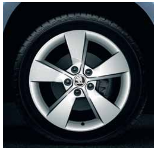
Llanta de aleación 7.0J x 17" Erebus para neumático 225/50 R17 en diseño plateado (5LO 071 497J 8Z8).