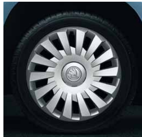
Tapacubos Nordic para neumático 6.0J x 16"; juego de 4 piezas (5E0 071 456).