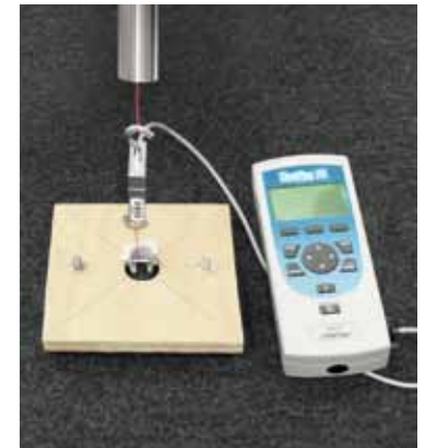
Dispositivo para la prueba del tacón. Prueba de fuerza de los elementos de fijación.