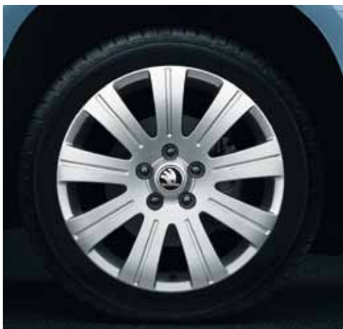
Llanta de aleación 6.0J x 17" Flash para neumático 205/50 R17 en diseño plateado (5E0 071 497B 7ZS).