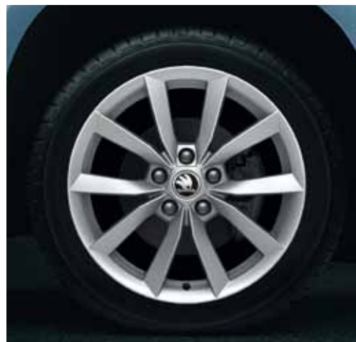
Llanta de aleación 7.0J x 17" Scudo para neumático 225/50 R17 en diseño plateado (5LO 071 497M 8Z8).