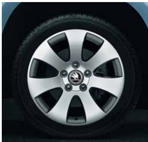
Llanta de aleación 7.0J x 16" Spectrum para neumático 205/55 R16 en diseño plateado (3T0 071 496 7ZS).