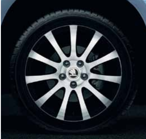
Llanta de aleación 7.0J x 17" Annapurna para neumático 225/50 R17 en diseño negro brillo (5L0 071 497D JX2)