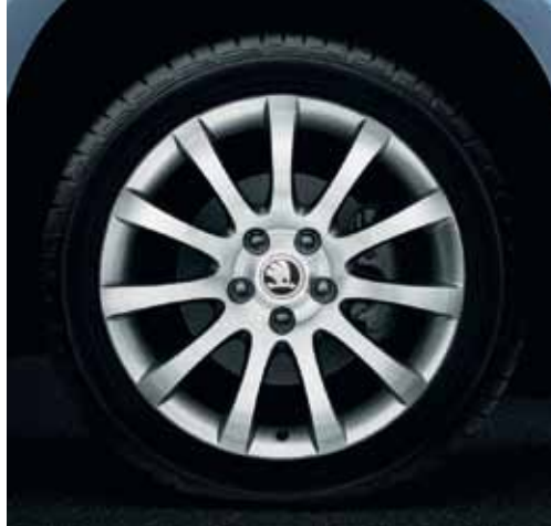
Llanta de aleación 7.0J x 17" Annapurna para neumático 225/50 R17 en diseño plateado (5L0 071 497C 7ZS).