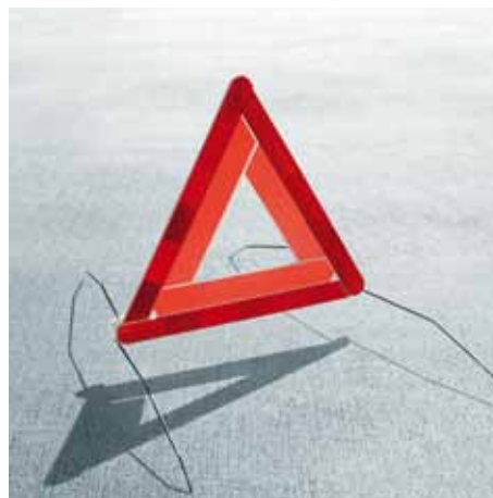
Práctico triángulo de seguridad con palas de metal plegables. Estable y de gran visibilidad para uso de emergencia en la calzada (GGA 700 001A).