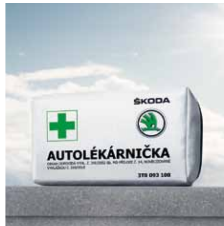
Botiquín de primeros auxilios cuyos contenidos cumplen los requisitos del Decreto modificado nº 216/2010 (GFA 410 010DE).