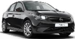
CORSA EDITION 1.2 XEL MT5 S/S 75 CV (55KW) CUOTA 224 €/MES* + IVA

Todas las cuotas incluyen: mantenimiento, cambio de neumáticos, gestión de multas, seguro Total Auto, asistencia en carretera e impuesto de circulación. Además, para vehículos eléctricos, un año gratuito** en tu suscripción nueva App "F2M Charge my car".