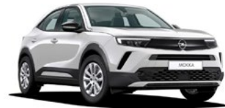
NUEVO MOKKA EDITION 1.2 T MT6 S/S 100 CV CUOTA 288 €/MES* + IVA