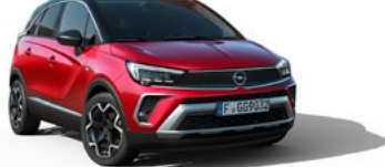
NUEVO CROSSLAND EDITION 1.2 GAS MT6 S/S 110 CV CUOTA 267 €/MES* + IVA