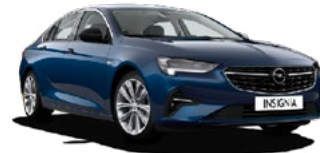
NUEVO INSIGNIA BUSINESS EDITION 1.5D DVH MT6 S/S 122 CV (90KW) CUOTA 467 €/MES* + IVA