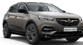
GRANDLAND X EDITION 1.5 CDTI S/S MT6 130 CV CUOTA 367 €/MES* + IVA