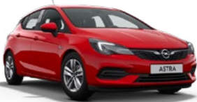
ASTRA GS LINE 1.2T SHL MT6 S/S 110 CV (81KW) CUOTA 294 €/MES* + IVA