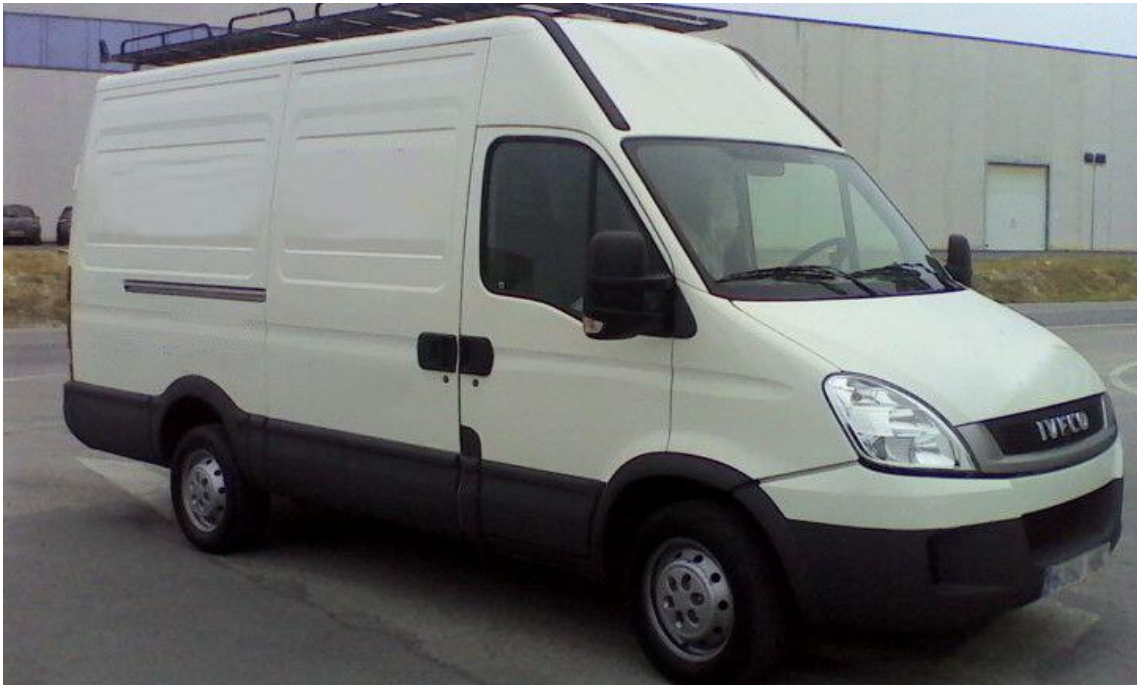
Foto 8: estado del vehículo tras la finalización de la reparación vista del. Izq.