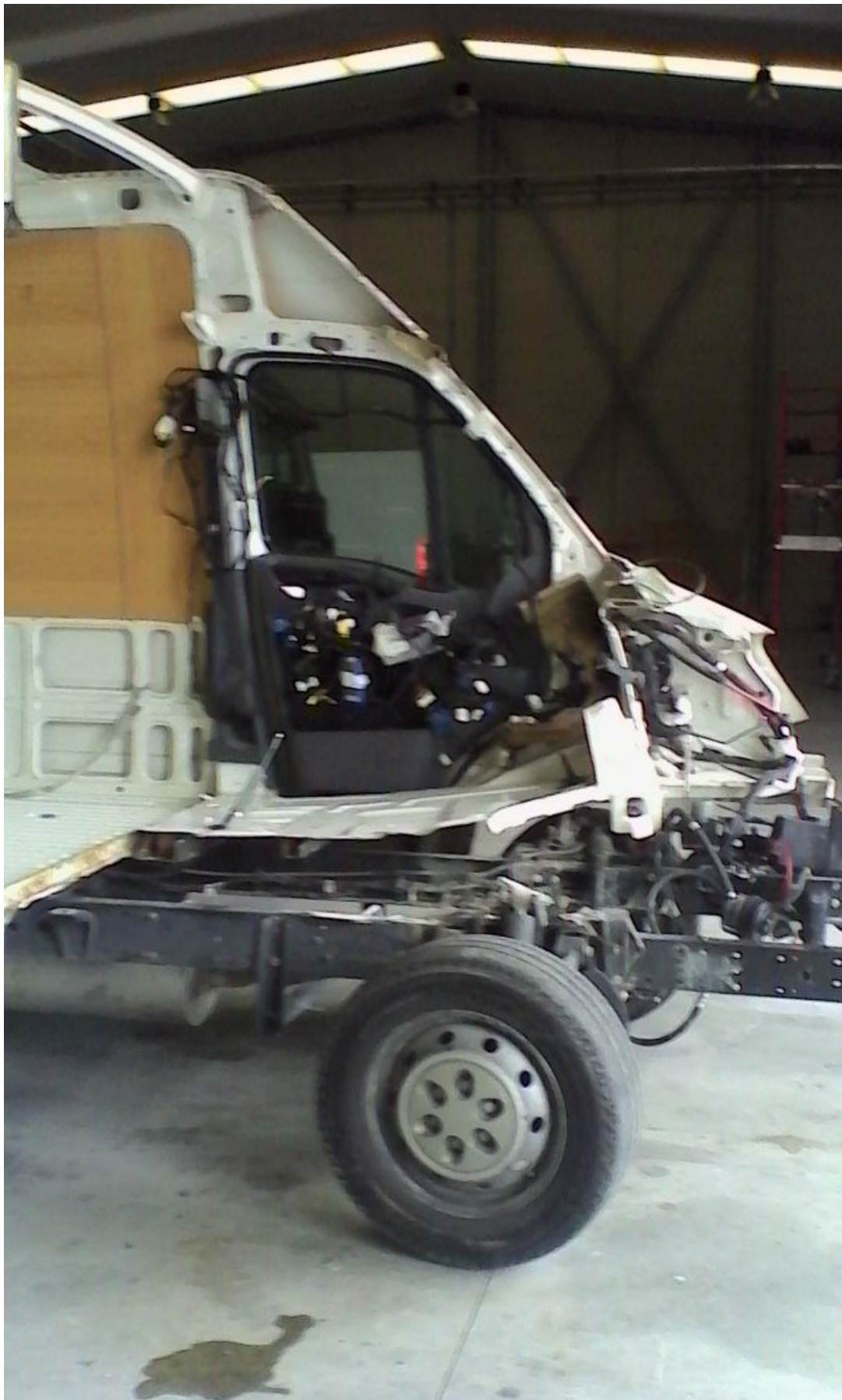
Foto 5: estado del vehículo tras desmontaje del motor completo visto desde lateral izq.