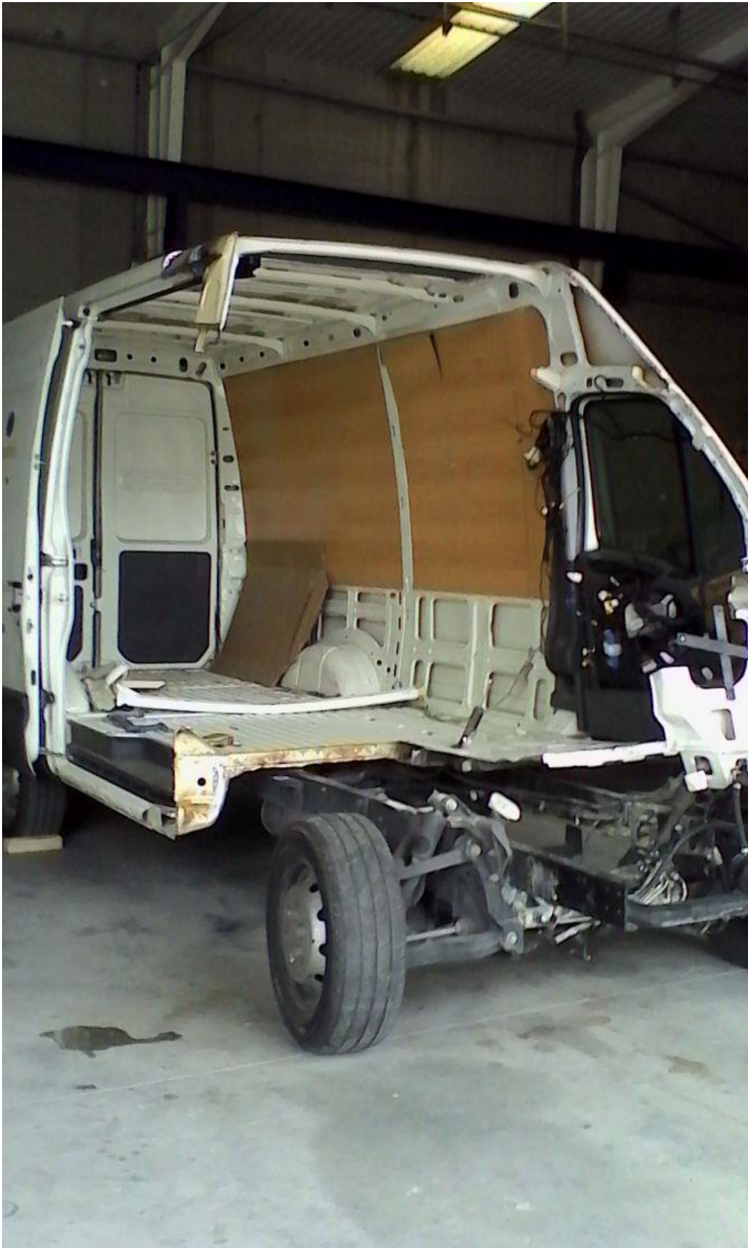
Foto 6: estado del vehículo tras desmontaje del motor completo visto por la parte del. Izq.