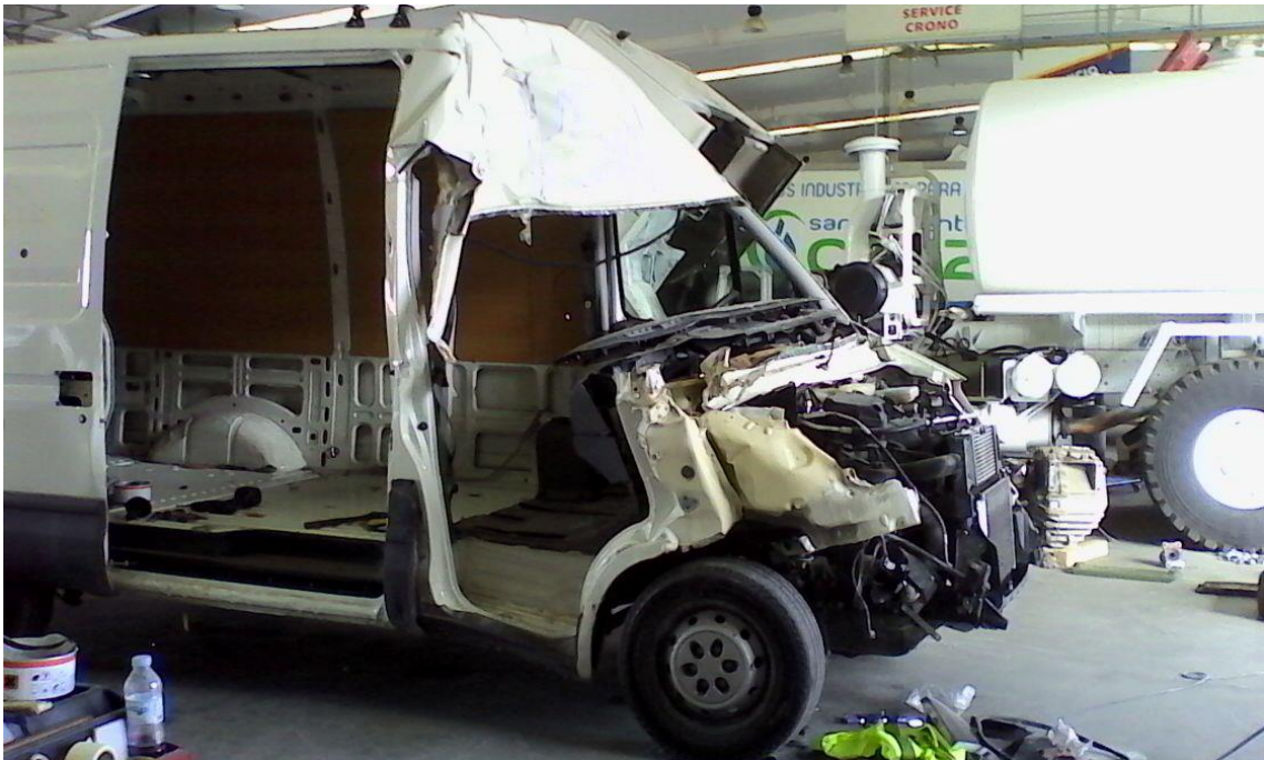
Foto 1: estado del vehículo tras el impacto recibido visto desde la parte del acompañante.