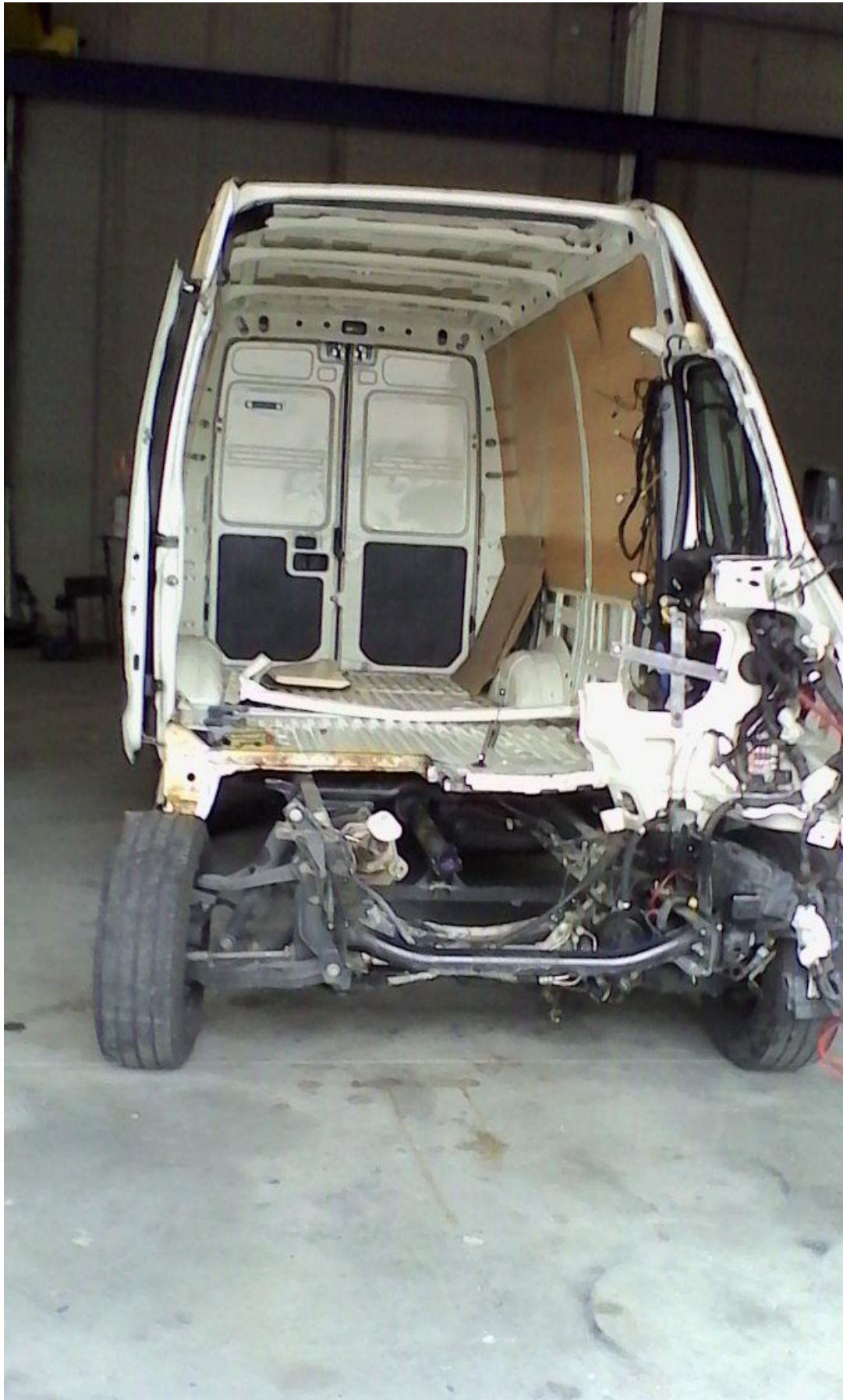
Foto 4: estado del vehículo tras desmontaje del motor completo visto por la parte delantera.