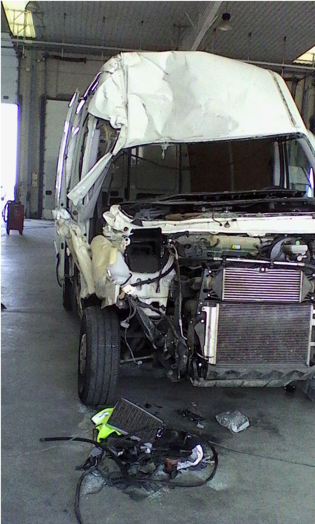
Foto 3: estado del vehículo tras el impacto recibido visto por la parte delantera.