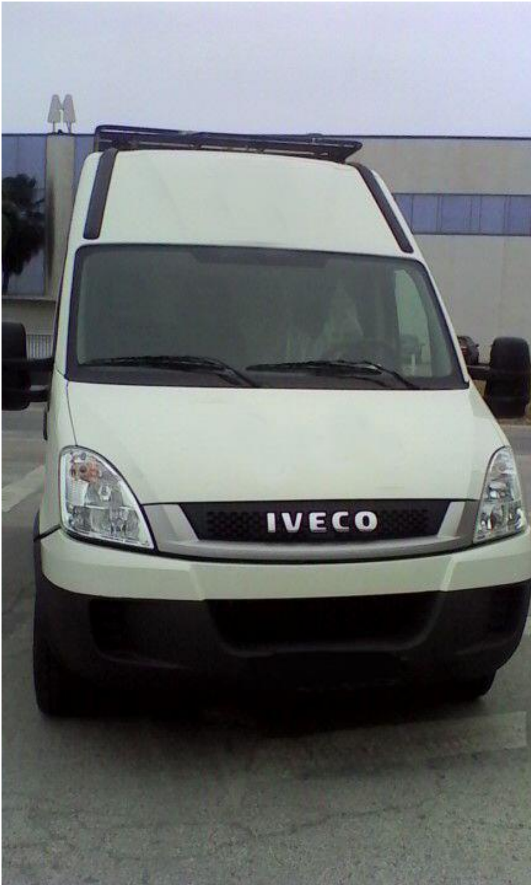
Foto 7: estado del vehículo tras la finalización de la reparación vista parte delantera.