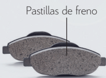
Pastillas de freno